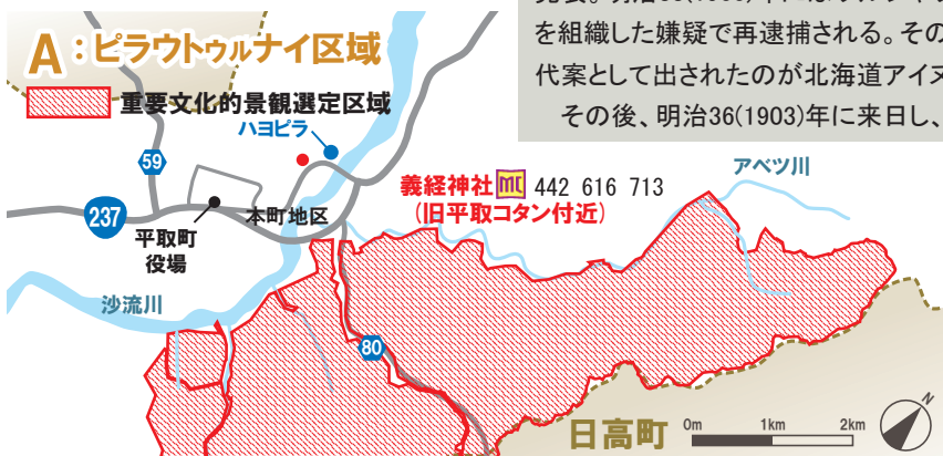
「アイヌの伝統と近代開拓による沙流川流域の文化的景観」 2007(平成19)年7月26日、重要文化的景観(国文化財)に選定