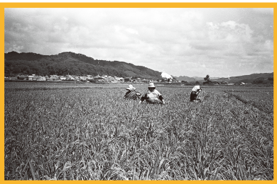
ロールスクリーンに展示している写真

稲を刈る道具、縄なえ機、作物や稲を脱穀するための道具などが展示されています。窓際にはロールスクリーンが掛けられており、昭和40年代の農業作業風景をお見せしています。