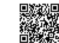
ホームページ QR コード