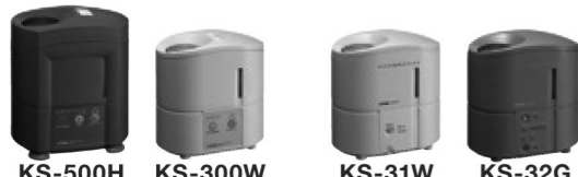
KS-500H KS-300W KS-31W KS-32G 平成10年度(1998年度)製造・販売 平成5年度(1993年度)製造・販売

回収専用フリーダイヤル(通話料無料)TDK株式会社「加湿器お客様係」 受付時間 9:00～19:00 (土・日・祝日も含む)