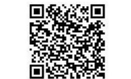
ホームページ QR コード