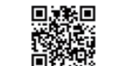
「平取町防災情報メール」を登録願います。

平取町社会福祉協議会 ☎ 4-2267 平取町外2町衛生施設組合 ☎ 2-2024 平取消防署 ☎ 2-2361