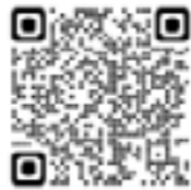
線状降水帯 QR コード

さらに、予測精度を高めるため、今後も大学等の複数の研究機関と連携して線状降水帯のメカニズム解明に向けた高密度な集中観測を実施します。また、文部科学省・理化学研究所の全面的な協力を得て、スーパーコンピュータ「富岳」を活用して、開発中の予報モデルのリアルタイムシミュレーション実験を実施します。