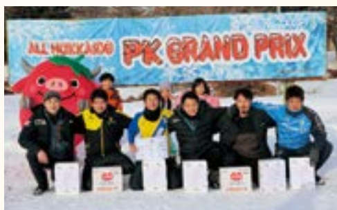
優勝 シリエージョ (浦河町)