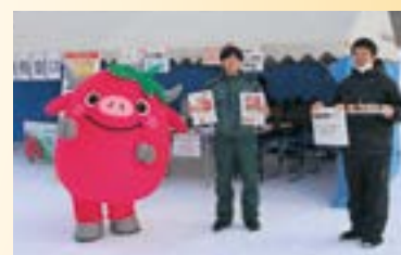
ふるさと納税ブースも開設