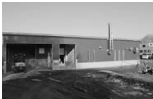
木質バイオマスセンター

「木育」の推進、町内の公共施設などの木質化による木材利用の促進を継続的に進めます。 林業現場での人材確保は、令和5年度に創設した林業担い手対策事業の取り組みの成果として、北海道立北の森づくり専門学院から令和6年度2名が、町内での就職を希望しています。 さらに、担い手不足や作業従事者の高齢化が著しい林業、木材製造業について、人材確保の取り組みを強化していきます。 また、木質バイオマスの活用を進めるため、地域内での林地残材や未利用材の活用などによる原料供給体制の具体的検討を進め、木質バイオマスの燃料での再生可能エネルギーの創出による地域内経済循環型システムのさらなる構築を目指します。