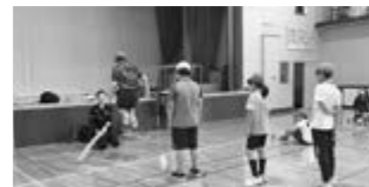
貫気別小学校 バルシューレ講習会

□昨年に引き続き、全国的に児童・生徒の運動時間が減少しています。下記にある体力向上策を学校と家庭・地域が共有し、一人一人の子どもに運動の日常化を意識して取り組ませることが重要です。