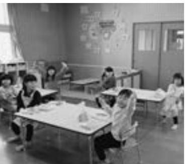
苺菜へき地保育所

育てしやすい環境づくりなど、子どもを生み育てることをめぐる諸課題を解決することは重要です。そのために、子ども・子育て支援新制度に基づき、「質の高い幼児期の教育・保育の量的確保」「地域の子ども・子育て支援の充実」などに向けた取り組みを今後とも推進するとともに、平取町の次代を担う子どもたちが健やかに育ち、子どもを持ちたいと思う人が安心して子どもを産み育てることができるよう環境づくりに取り組んでいきます。