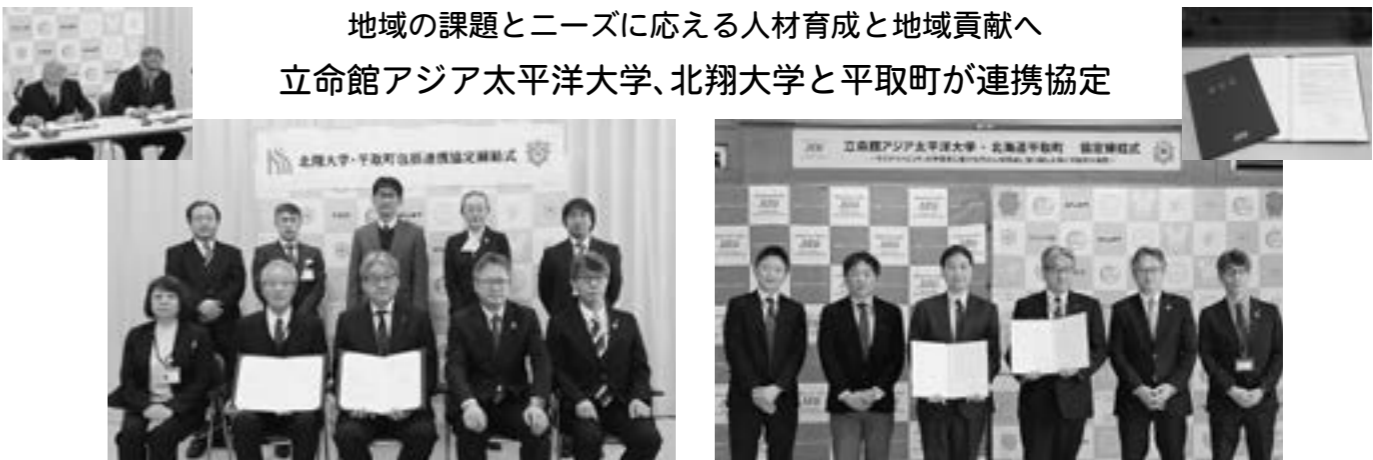
北翔大学 立命館アジア太平洋大学

平取町は2月9日(金)に立命館アジア太平洋大学(別府市)と友好協定を、28日(水)に北翔大学(江別市)と包括連携協定を締結しました。 立命館アジア太平洋大学は、平取町が開催するアイヌ文化に興味のある全国の学生が集まり、様々な視点からアイヌ文化振興に関する提案を行う「大地連携ワークショップ」に、今年も学生が参加しています。 アイヌ文化や伝統が色濃く残る平取町をフィールドに、文化の継承を活かした観光施策や人材育成を学びながら、まちづくりの方法や課題解決策を学生自身が考える場として友好的な交流を進めます。 北翔大学は、地域を育て、地域に支えられる大学を目指す「地域貢献大学」として、様々な産官学連携事業を積極的に展開しています。平取町と連携し、教育活動に関する相互協力や人材育成をはじめ多様な事業を総合的に活用し、交