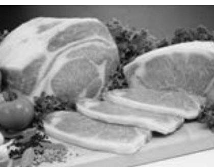
ふるさと納税返礼品(びらとり和牛)

《財政運営》 財政運営に関しては、中長期的な視点で常に財政状況を検証し、健全化と持続可能な財政運営に取り組みます。令和5年度、6年度の予算編成は、人件費、公債費等の義務的経費の増加により、投資的経費への充当一般財源が不足するため、基金からの繰入額が増加し、令和6年度も5億円近い繰入れが予定され、財政の硬直化が懸念されます。 特別会計を含む令和5年度末の起債残高は97億円を超え、今後、経常経費のさら