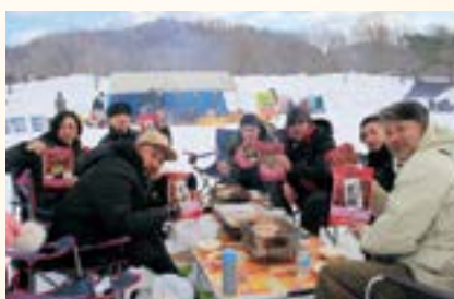
美味しい焼肉でエネルギー充電!!