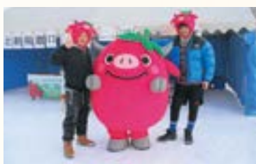
選手も一緒に「ハイ、ポーズ!」