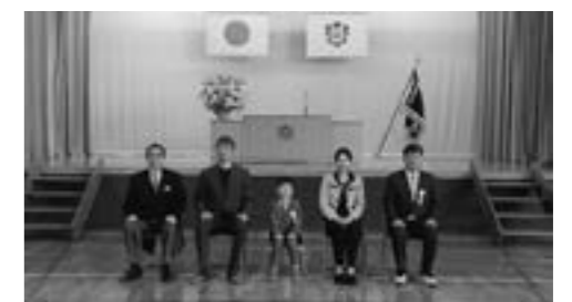
貫気別小学校 入学式