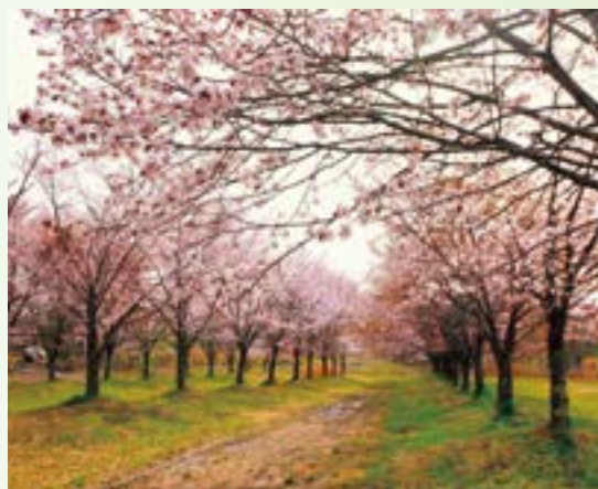
登 由吉 氏邸内（岩知志）