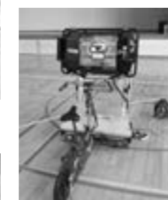
自転車シュミレーター 〔サイズ〕 全長227cm・高さ140cm 幅 99cm・重量 88kg

交通安全について正しい知識を持ち、交通事故の防止に役立つため、4月23日（火）に平取中学校、24日（水）に振内中学校で交通安全教室が開催されました。今回は、自転車運転の際に起こりうる危険を体験できる「自転車シュミレーター」を使い、参加・体験・実践型の講習を行いました。シュミレーターでは、「学校に行く」「買い物に行く」などの走行コースの選択により、運転を考えて学ぶ、また「走行再生機能」で自分の運転状況を見直し、学習するなど、危険予測能力や自転車の安全利用の向上につながる教室となりました。