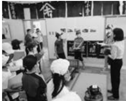
開拓財産展示施設

9月1日(水)・8日(水)、町内の5つの小学校が合同で社会科見学学習を実施しました。3年生は、日高西部消防組合平取消防署とトマト農家、4年生は平取町外2町衛生組合と開拓財産展示施設を見学しました。例年は1日日程で、トマト選果場やふれあいセンターびらとりも見学していましたが、昨年度から新型コロナウイルス対策のため、半日日程となりました。学習のねらいは、「子どもたちの社会的視野を広げるため、町内の産業や公共施設の見学・体験活動を通して、働く人の姿を見つめ、施設の機能や役割を理解し、地域との関わりを学習する」というものです。事前の学習を基に、真剣なまなざしで見学し、質問したりメモを取るなど集中して取り組んでいました。開拓財産展示施設では、「蓄音機にびっくりした。今はポタで回したりと準備が大変だったんだな」という感想が聞かれました。