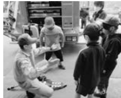
日高西部消防組合平取消防署