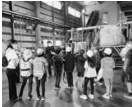
平取町外2町衛生組合