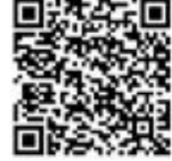
『平取高校トマトクラブ考案レシピ』QRコード

8月6日(土)、7日(日)の2日にかけて、町と平取高校トマトクラブの生徒が、「さつぽろ羊が丘展望台夏休みイベント2022」に参加しました。 びらとりトマトの試食と、平取高校インスタグラム『と、びらとり』のフォローでトマトをプレゼントするなどして、町特産品のPRのほか、同クラブが考案した平取の食材を使ったレシピの配布、平取高校のSNS活動のPRにより、ブースに訪れた約200人の来場者へ、平取町と平取高校の魅力伝えることができました。