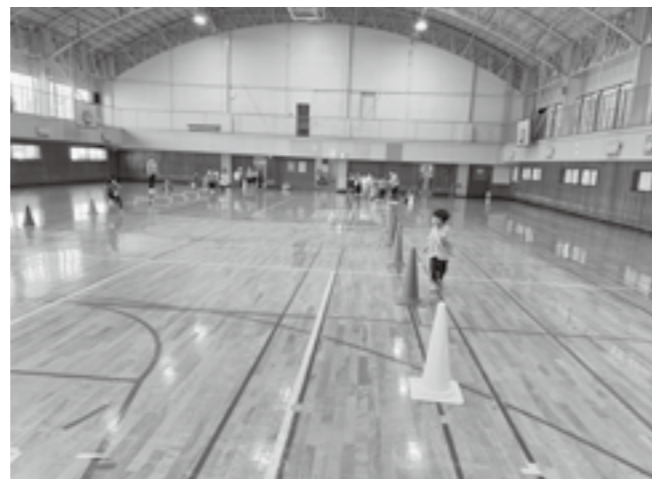
障害物リレーの様子