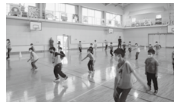
(紫雲古津地区 頭を使ったジャンプ)

レクリエーションの内容は、頭を使ったジャンプ(指示された方向と同じ方向を声に出しながら体は逆方向に飛ぶ等)及び障害物リレーを行い、元気いっぱいに身体を動かし、汗を流しました。