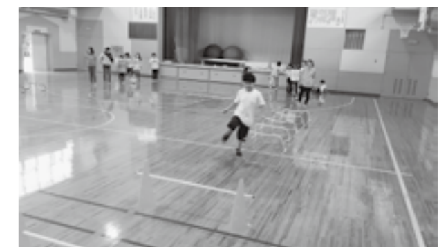
(二風谷地区 障害物リレー)