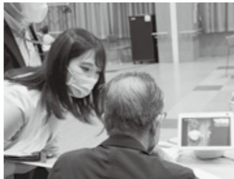
民生委員と会話する参加者

6月30日（木）、町では新しい高齢者等の安否確認の取り組みとして、郵便局・平取町社会福祉協議会と連携し、スマートスピーカーを活用した高齢者等見守りサービスの実証事業説明会を開催しました。 町関係機関からのお知らせ、体調・服薬確認。あらかじめ登録された親族等とのビデオ通話も、声でスピーカーへ指示することで簡単に操作できます。 また、無料通話アプリ「LINE E」を連携することで、協力者の生活状況も確認できます。 実証事業は、協力者13名の家にスマートスピーカーを設置し、8月1日から9月30日までの期間実施され、町内での導入が検討されます。