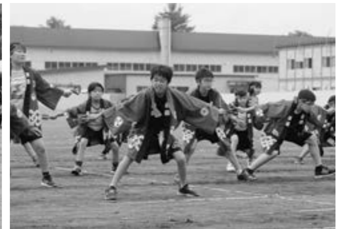
「心を一つに協力して ミラクルをおこせ!!」 (貫気別小 6月19日)