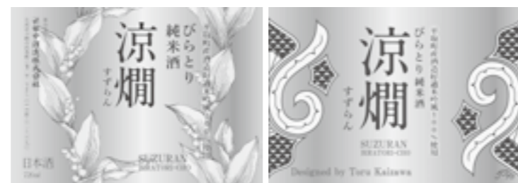
「すずらんラベル(左)」と「アイヌ文様ラベル(右)」