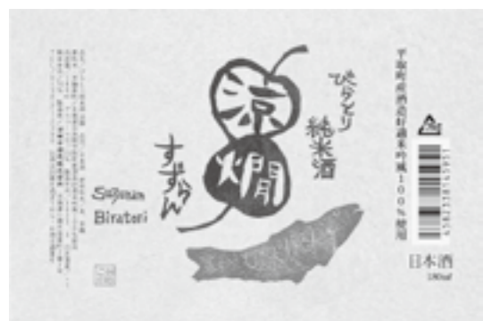
「ヤマメ」をモチーフとした版画ラベル