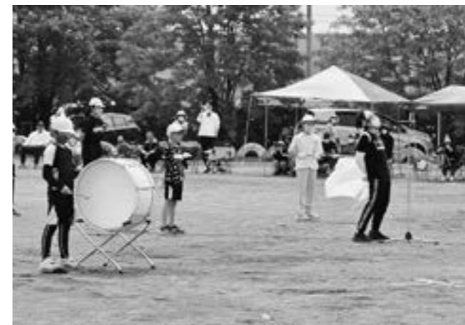
「全力でいどみ最高に楽しい運動会にしよう」 (紫雲古津小 6月18日)