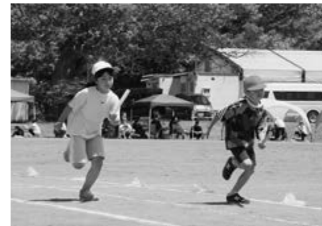
「つなげよう!! 応援を力に」 (二風谷小 6月12日)