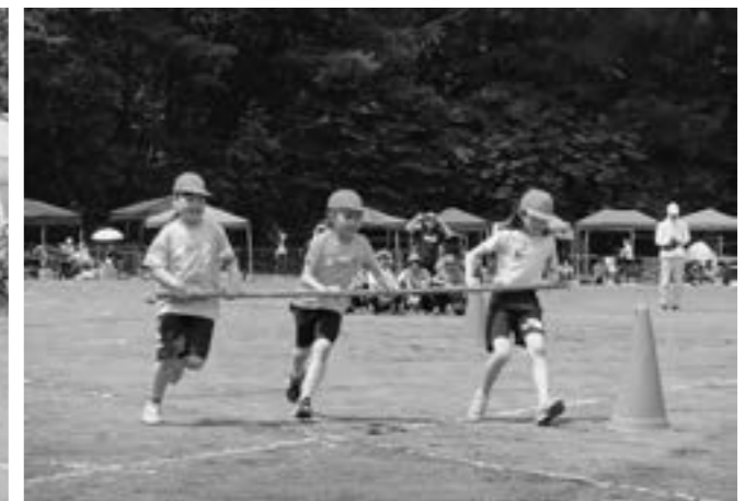
「仲間と1つに! 最高の勝利をつかみとれ!」 (平取小 6月18日)