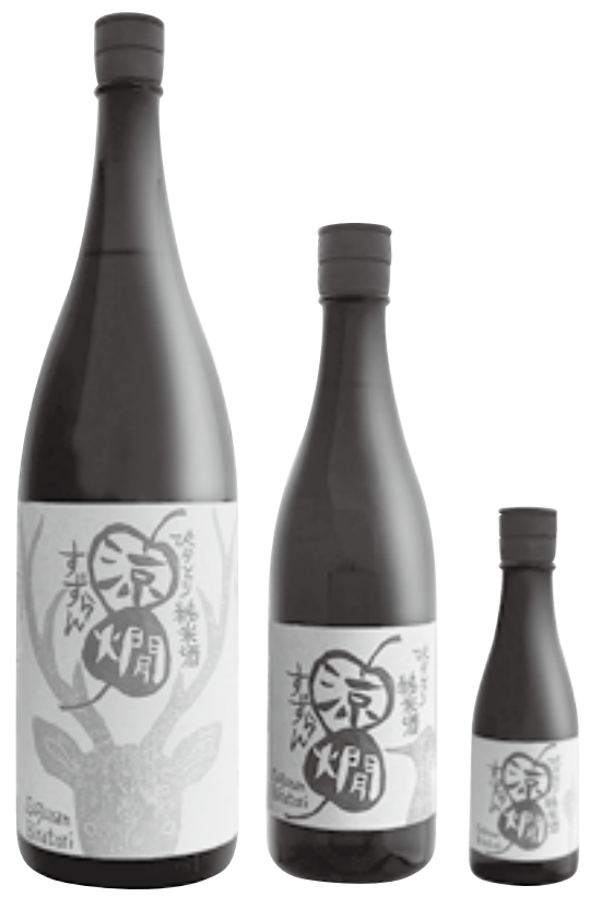
※涼爛の文字は、桂の葉をイメージし、左からシカ、クマゲラ、すずらんの葉のデザイン。

また、アルミ缶も3種類のデザインがあり、持ち運びが便利でアウトドアでも大活躍!!熱伝導率が良いので冷酒や熱燗にもオススメです。今年の出来は、食事を引き立てるような仕上がりました。ぜひ、町内の美味しい食材と一緒に楽しみたいと思います。