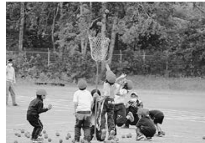
「全員で協力して 最高の運動会にしよう」 (振内小 6月11日)

6月に町内5つの小学校で、予定どおり運動会が開催されました。今年度もコロナウイルス感染症対策のため、種目を縮減し午前日程で行い、また参観者も制限しての実施となりました。2週間程の練習を通してがんばり続けた子どもたち。運動会当日は、その成果を十分に発揮し、競技や演技、児童会活動で笑顔いっぱい輝く子どもたちの姿が見られました。 初めての運動会を通して一回りたくましくなった1・2年生、見事な力強さでリーダーとして下級生を引っ張ってくれた6年生。全校の児童が、最後までやりきった自信と身についた力を、これからの生活や学習の中でさらに生かして欲しいと願っています。