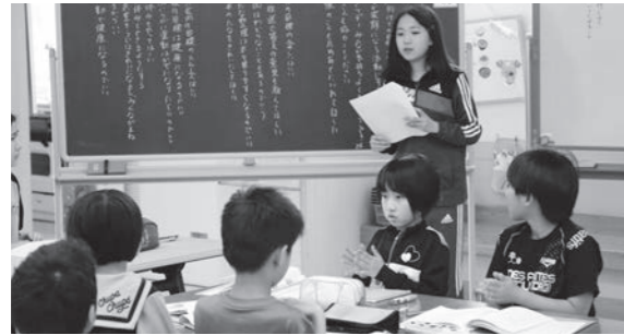
紫雲古津小学校：児童総会