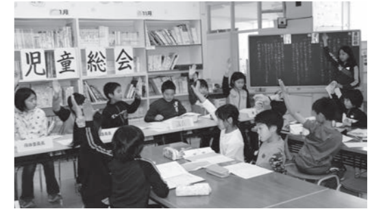
紫雲古津小学校：児童総会

「令和」という新時代の幕開けを迎えました。町内の小中学校7校では、平成31年4月に新年度が始まって2か月が経過し、新入生と新しい先生を迎え、新たな環境のもとで、様々な教育活動をすでに展開しています。どの学校においても、未来をたくましく「生きる力」を育むため、確かな学力、豊かな心、健やかな身体の育成を柱に、教育活動を推進しています。本年度の各学校の児童数、重点目標（キャッチフレーズ）などは次のとおりとなっています。