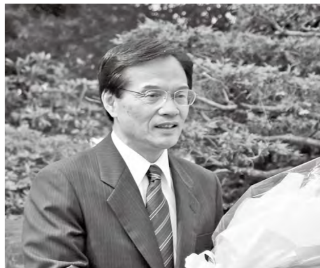
初登庁時の川上町長