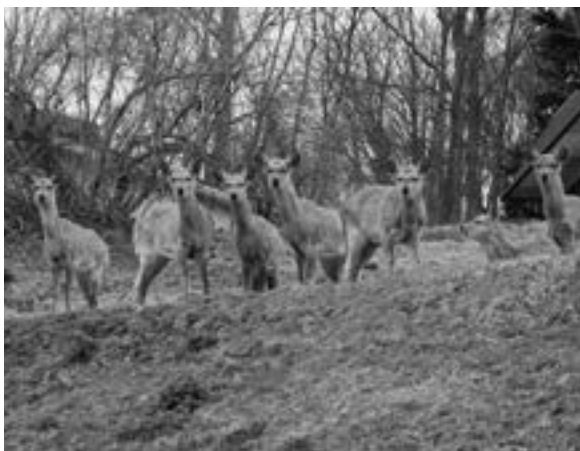
～エゾシカ(役場駐車場より)～

役場駐車場にエゾシカが連日訪れ、春の若草を食べています。多い日は30頭前後の群れで、裏山へ駆け抜けています。歩行中、シカと遭遇しても決して近寄らないようにしましょう。また、自動車との衝突も大変危険なので、運転にも十分留意しましょう。