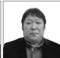
福與 弘一 苧負 5-5036