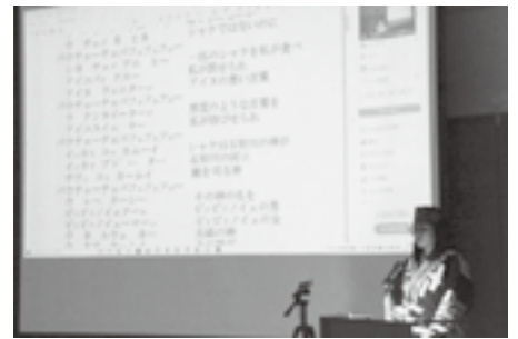
シシリムカ文化大学講座

【アイヌ文化の振興】 「平取町アイヌ総合政策推進基本計画」や「平取町アイヌ施策推進地域計画」を基本に、アイヌ政策推進交付金などの活用により、さらに関連事業を推進してまいります。 平取町アイヌ文化振興公社が担うイオル再生事業、21世紀アイヌ文化伝承の森プロジェクト事業、大学間連携事業、シシリムカ文化大学運営事業、伝承者育成事業については、さらに内容の充実を図り、継続を基本に進めてまいります。