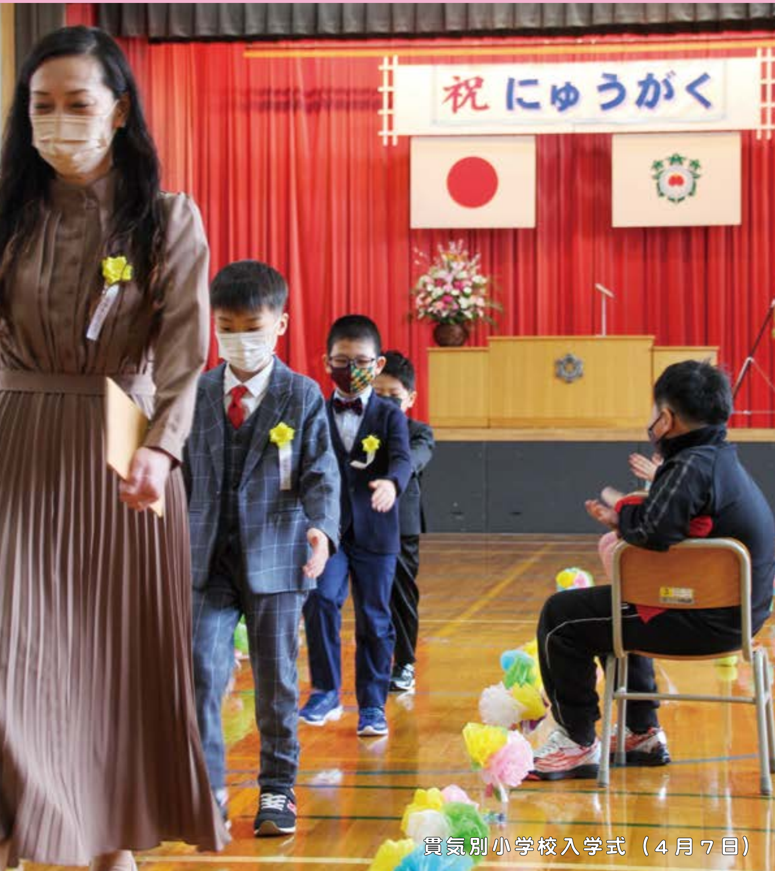
貫気別小学校入学式（4月7日）