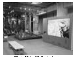
歴史館に導入された100インチモニター

また、平取ダム建設工事に伴うアイヌ文化環境保全の調査成果などの展示が加わることから関係課と連携した運営を図ります。 ▼文化財課事業や二風谷コタンの情報を提供する「シシリム力文化財だより」の誌面の充実に努めます。