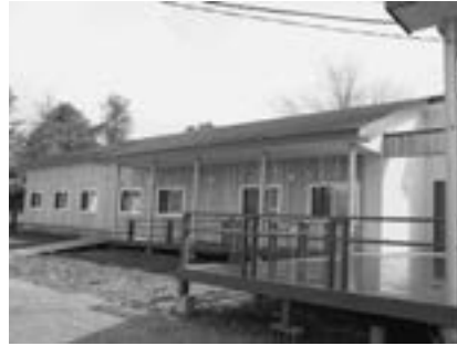
こころのホームふれない

また、令和3年度に再開された、認知症グループホームについては、今後も円滑な運営が図られるよう、然るべき支援を継続してまいります。