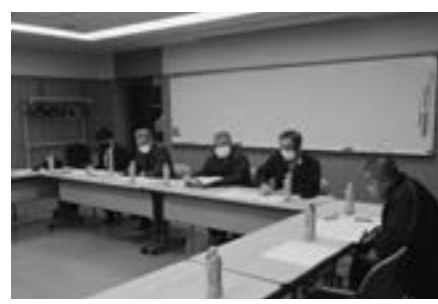
自治振興会役員会の様子

急速な人口減少や高齢化により、地域の自治会、町内会活動が維持できない状況が懸念されています。各地域での組織の在り方や再編なども視野に、コミュニティの維持継続に向け、自治振興会や関係団体と議論協議し方向性や具体的方策を探ってまいります。