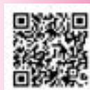
ホームページ QR コード

完全予約制 ☎ 0120-013-621 (ご予約受付時間) 平日 9:00~18:00 個別相談なので、他の方と顔を合わせることはありません。