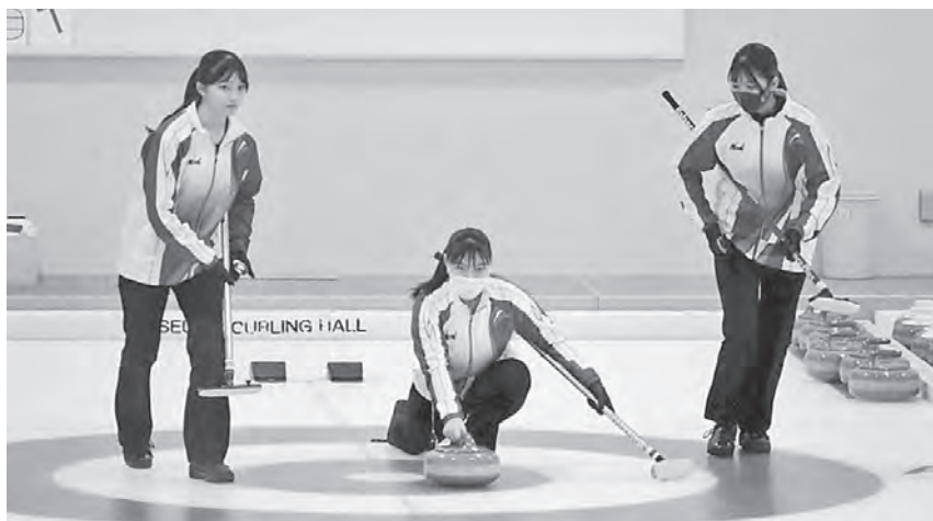
◆第42回 北海道カーリング選手権大会（札幌市）◆