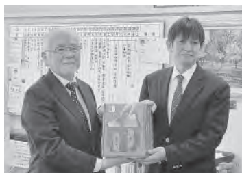
平取養護学校 贈呈式 (寄宿舎用ゲーム機本体)