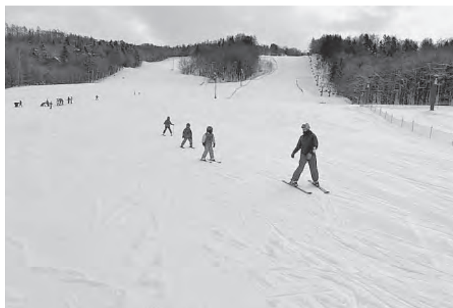
基礎技術をしっかりと学びました