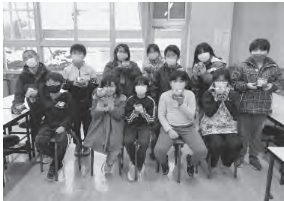
振内小学校の様子

受け取った児童・生徒から喜びの声と笑顔があふれ、楽しい一日を過ごすことができました。ご厚意に感謝いたします。