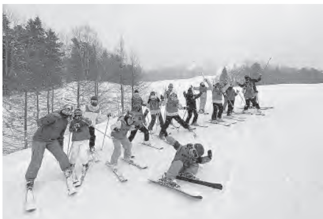
みんなで楽しく滑りました

当日は、一時雪が降ることもありましたが、講師の方々の指導により、初めて滑る子ども達も第一リフトを使い「ファミリーコース」を滑れるようになりました。楽しみながらスキーやスノーボードの基礎技術をしっかりと学ぶことが出来た1日となりました。