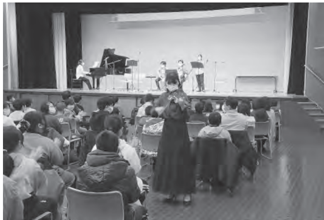
ヴァイオリンの移動演奏