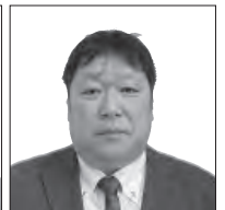
福與 弘一 荷負 5-5036