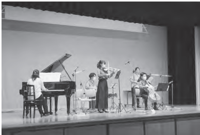
5人の綺麗な演奏に聴き入りました

さらに、開催時期ならではのクリスマスソングの演奏もあり、児童達は手拍子で演奏に参加して、大いに盛り上がりました。参加した児童からは、演奏を聴いて「もっと聴いていたかった」、「学習発表会で演奏した曲があって嬉しかった」等の感想が寄せられ、とても楽しいひと時となりました。