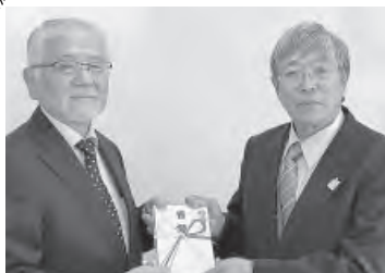
ケアハウスしずか 贈呈式 (自動体外式除細動器)

今年度は例年より規模を拡大して実施しており、4月に引き続き12月27日(火)、平取養護学校と、ケアハウスしずかにそれぞれ手渡されました。