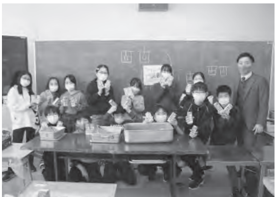
平取小学校の様子