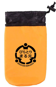
ペットボトルホルダー （ノベルティグッズ）