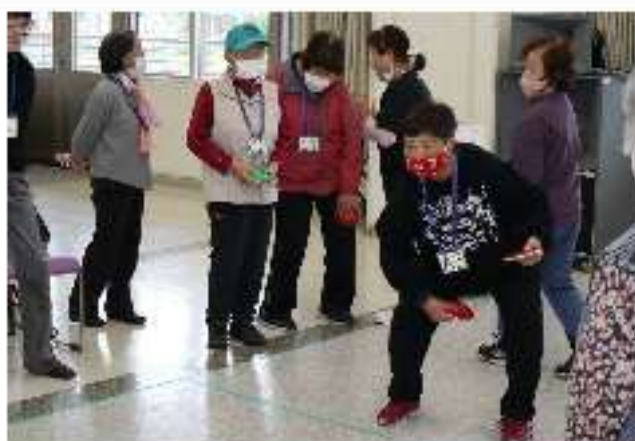
当町の3名は初めてのカーリンコン体験でしたが、最後まで楽しい研修会となりました。

10月16日、新ひだか町公民館において日高管内身体障害者福祉協会研修会が開催され、町身障協会の3名の方が参加しました。研修は北海道カーリンコン協会講師の指導のもと、カーリンコン対抗試合が行われました。車椅子や手話が必要な方もボランティアの支援を受けながら参加でき、参加者全員が協力の中で行われ親睦が深まりました。