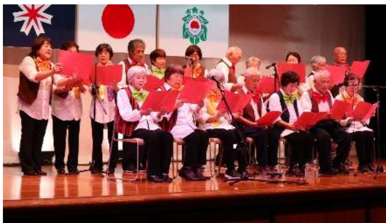
コーラス「里の秋」を発表した振内老人クラブの皆さん