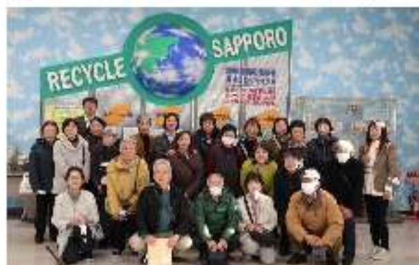
駒岡資源選別センターにて

10月30日、札幌市方面へ日帰りでの研修へ行ってまいりました。真駒内にある駒岡資源選別センター（札幌市：2か所のうちの一つ）ではリサイクルされるペットボトル、ビン、缶の選別作業を見学しました。午後から札幌市青少年科学館のプラネタリウムを觀賞しました。当日夜から翌朝にかけての札幌市の夜空が投影され、世界最高水準の一面に広がるプラネタリウムを楽しむことが出来ました。