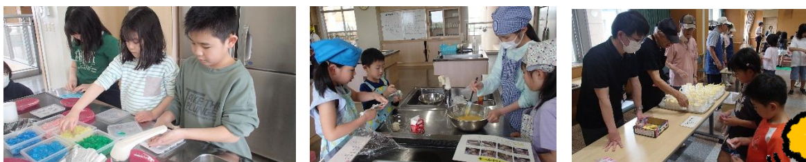
クラブ室 いろいろなおもちゃで遊んでみませんか？