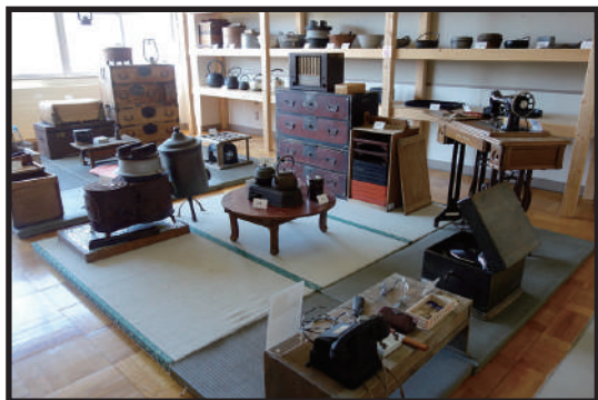
昭和初期以降の暮らしを再現