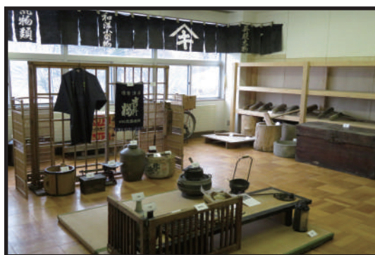
商業・お祭りに欠かせない道具など