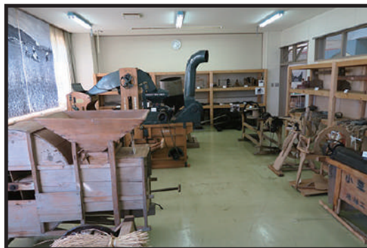
稲作や酪農に関わる道具類