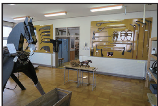
明治後半以降の林業道具を展示

北海道の開拓期以降に使用された民具について、平取の暮らしが 移り変わってきた様子と合わせて展示しています