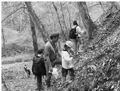
キナアカラ (イオルの森 4月29日)