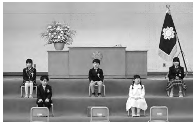
入学式(振内小学校)

5月の末から6月にかけて、小中学校では体育大会や運動会が開催されます。元気いっぱい輝いている児童生徒の頑張る姿が見られるでしょう。 体育大会(体育祭)・運動会開催日 5月27日 平取中学校体育祭 6月3日 振内中学校体育大会 6月10日 振内小学校 6月11日 二風谷小学校 6月17日 紫雲古津小学校 平取小学校 貫気別小学校