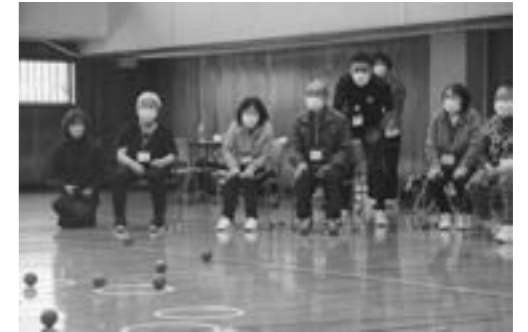
ベタンクを取り入れたプログラム

4月15日、全道27番目の開催となる地域まるごと元気アッププログラム（通称：まる元）が平取町民体育館で開催されました。この日、介護予防・認知症予防を目的としたこのプログラムに、約50名が参加して身体を動かしました。鳥井健康運動指導士から、座りながら腕と足を交互に組み替える動きや、ベタンクを使った軽スポーツを教わり、参加者同士が楽しく和気あいあいとなる時間を過ごしました。これから1年間、毎週プログラムが実施されます。