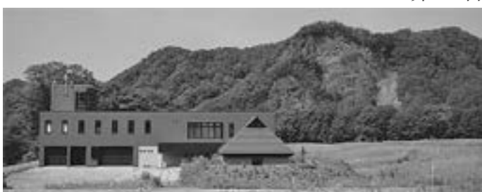
チセをモチーフにした平取ダム管理棟