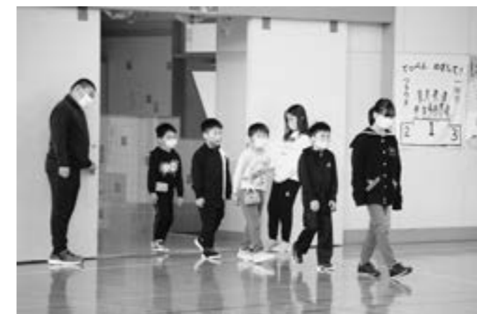
1年生を迎える会（紫雲古津小）

5月の末から6月にかけて、小中学校では体育大会や運動会が開催されます。今年度も新型コロナウイルス感染症予防のため、午前日程での開催となります。