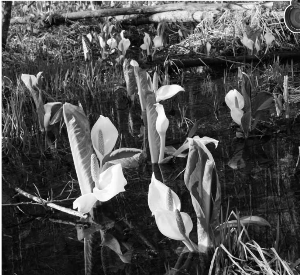
水面に映る水芭蕉