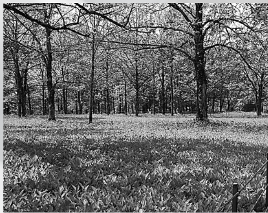
すずらんに映える白樺