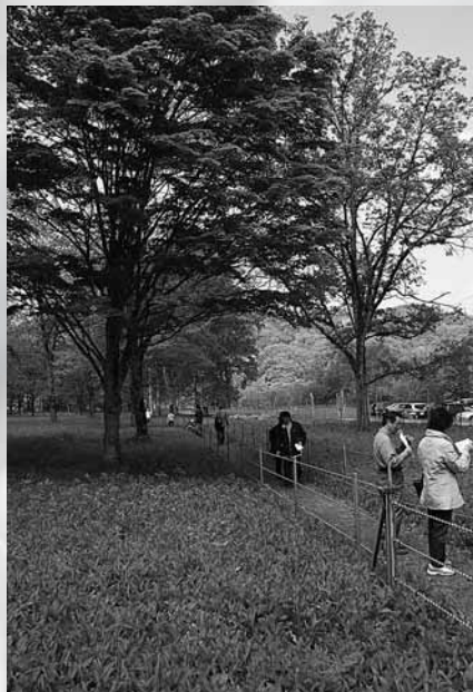
すずらんの香りに包まれる散策路