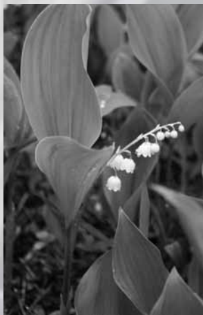
花ことばは「幸福のおとずれ」