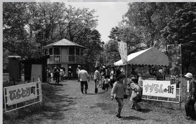
ようこそ、すずらん観賞会へ