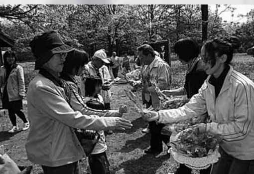
先着 150人に根付きすずらんをプレゼント