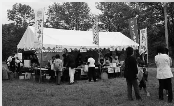
肉と野菜を販売する商工会女性部

6月、初夏の気配に花開く季節。 芽生のすずらん群生地も白い香りのペールにおおわれます。 5月30日から6月7日まで「第25回すずらん観賞会」が今年も開催されました。 びらとり和牛バーベキューや根つきすずらんプレゼントのイベントデーの6月1日、7日の日曜日は雨になりましたが、開放期間中（6月15日まで）約8千300人のお客様が全国から訪れています。 鹿兒島から来た女性は「一度見に来たかった。やっと願いがかないました。」とやさしくほほえんで話してくれました。