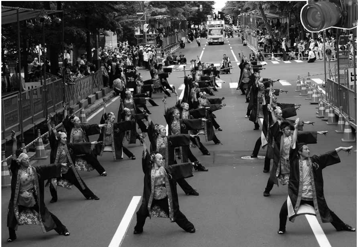
第18回 YOSAKOI ソーラン祭