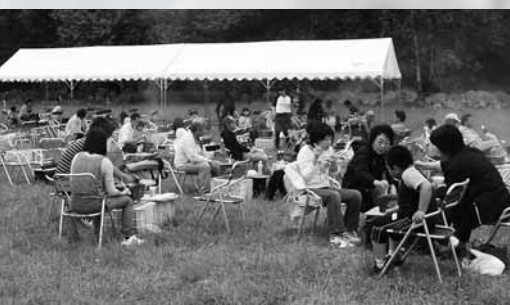
大人気のバーベキューコーナー