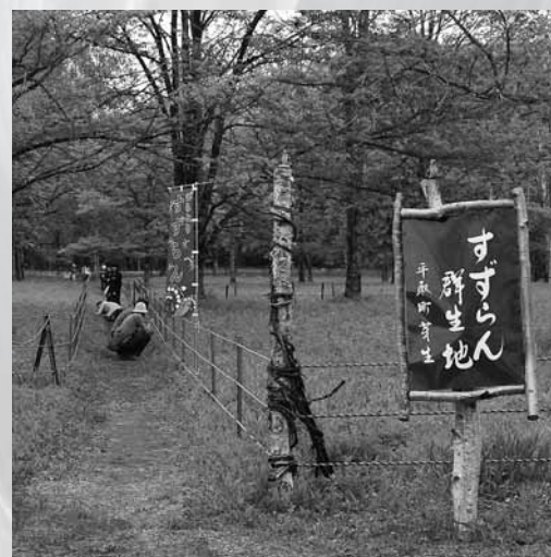
ベストショットを求めて...

約15haの群生する野生すずらんは、全国でも平取町にしかない貴重な「まちのたからもの」です。 来年は会場までの道路も整備されることから、観賞会中のイベントなども充実させ、より多くの方にすずらんを楽しんでいただきたいと考えています。