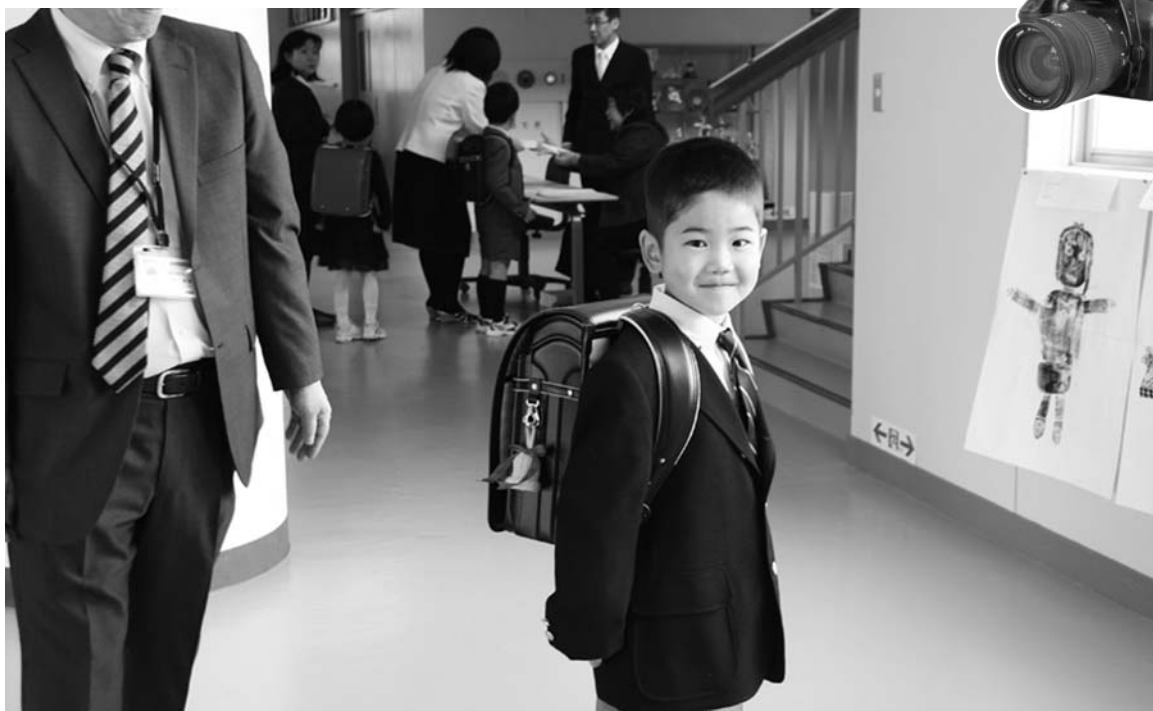
■ピカピカのランドセルに「愛の鈴」(4月7日 平取小学校)

交通安全を願う「愛の鈴」が、今年も商工会女性部の皆さんから新入学児童へ贈られました。