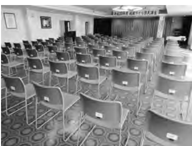
ミーティングチェア 150脚

自治総合センターは、宝くじの売上金の一部を市町村や自治会組織が行う住民自治活動に助成し社会に貢献しています。今回更新整備された備品は、中央公民館での各種住民活動に活かされます。