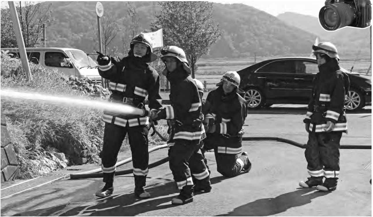
■平取高等学校職場体験（10月20日 日高西部消防組合消防署平取支署）

1・2年生の生徒たちが、町内外の各事業所のご協力により、実際に社会での仕事を体験しました。消防署では3名の生徒が、頑張って訓練を受けていました。