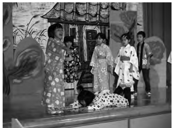
二風谷小学校の学習発表会

そんな力の伸張とともに、学びの面白さが感じられ、自分から進んで挑戦しているという感覚を持たせてくれる周りの大人（学校や保護者）の手助けが、子どもたちの確かな学び、生きる力を育む大きなうしろ盾となっていることを改めて感じさせられる各校学習発表会の様子でした。