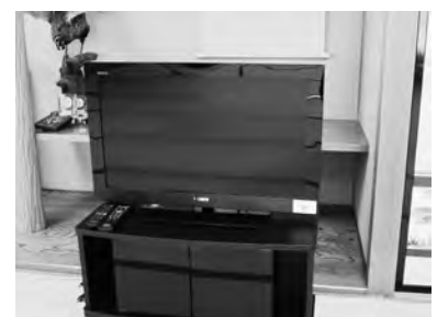
液晶テレビ 3台、BDプレーヤー 2台