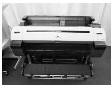
大判プリンター 1台