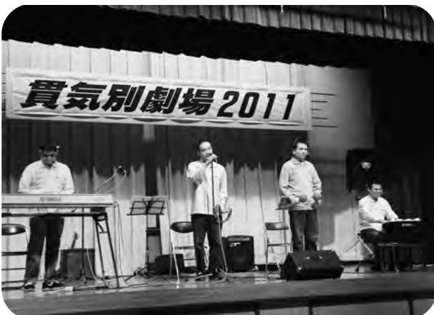
フォービート スマイル 4 Beat (安平町)