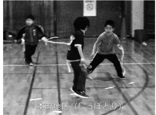
本町地区 (しっぽとり)

1回目のクラブでは、「しっぽとり」「輪くぐりリレー」「大波小波」などみんなで気軽に楽しめるレクリエーションスポーツを実施しました。