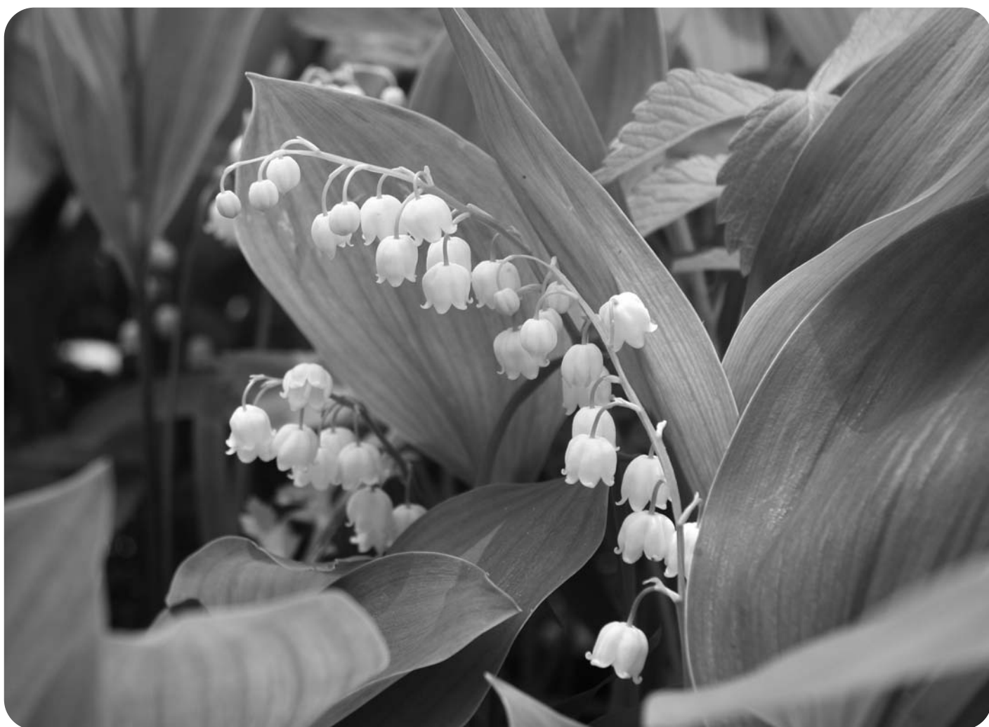
芽生 すずらん群生地 (6/4)