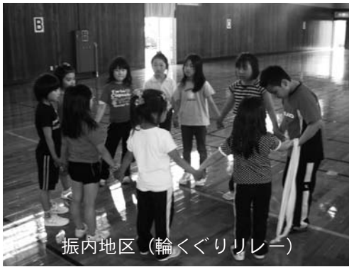
振内地区 (輪くぐりリレー)

しっぽとりでは息を切らしながらもお互いの「しっぽ」を真剣に取り合い。大波小波では児童も一緒に「♪大波小波～」の童歌を歌いながら長縄跳びを跳ぶなど楽しそうにクラブに参加していました。