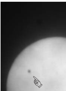
「金星の太陽面通過」

平取町では、朝から厚い雲に覆われ、観測自体が非常に厳しい天候でしたが、時折見せる日差しに、日食メガネを向けてみると、太陽を背景に黒い点があるのを確認できました。