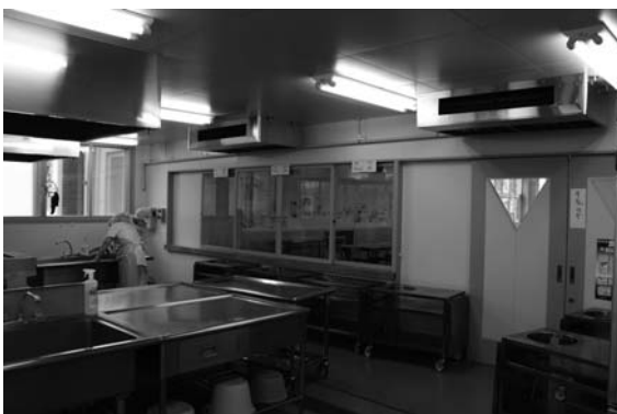
設置された厨房用エアコン

これまで、町教育委員会ではより安全な学校給食を提供するため、「学校給食衛生管理マニュアル」の完全励行と、厨房機器等について年次計画に基づき、整備を図っています。