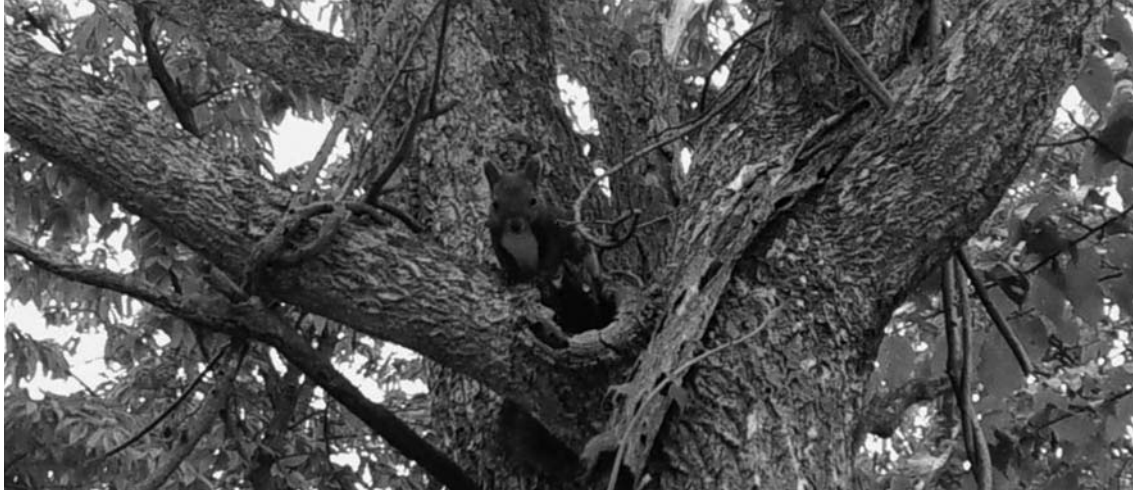
二風谷保育所向かいにある大木より、まるで園児たちを見守るように「エゾリス」が顔をのぞかせていたようです。