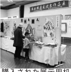
購入された展示用机