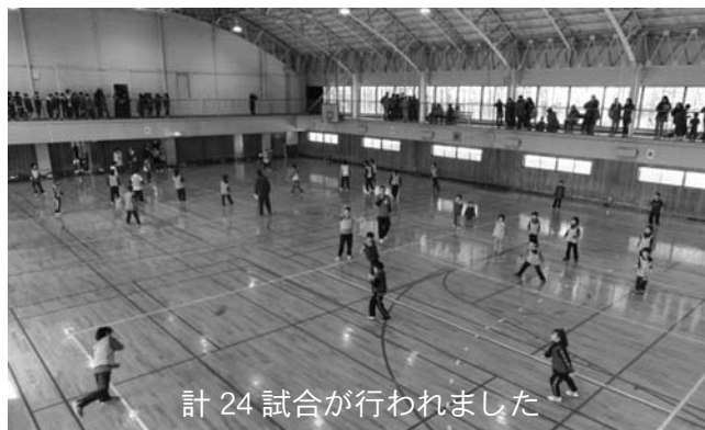
計 24 試合が行われました

2コートでそれぞれ1～3年生と4～6年生の2部に分かれて試合を行い、選手たちは日頃の練習の成果をぶつけ合い、熱戦を繰り広げていました。両部とも振内小のチームが優勝し、「AK 69」チームは4戦全勝という強さで大会を制しました。