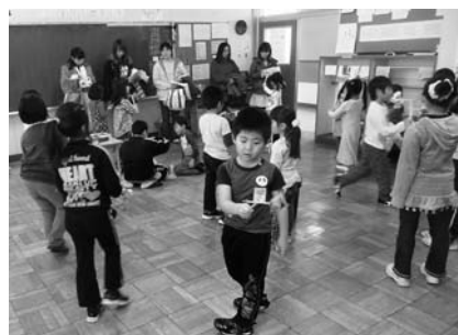
貫気別小学校(上)、振内小学校(下) の1日体験入学風景