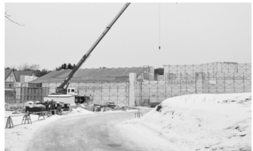
早期オープンに向け急ピッチで建設中

現在建設中の新しいびらとり温泉は、より親しみやすい名称とするべく公募して選考した結果、「びらとり温泉ゆから」と名称が決定しました。