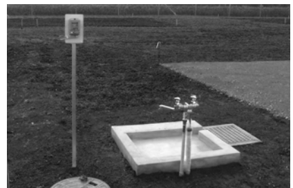
駐車場と水道も整備済