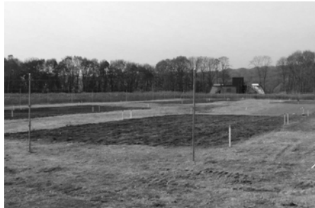
動物食害対策の柵も設置