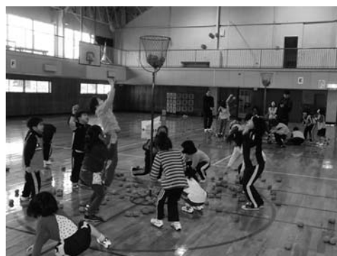
ボーナスボールがある「玉入れ」

本町と振内は1～3年生まで、貫気別は1～6年生まで参加できますので、是非、一緒にスポーツを楽しみましょう。