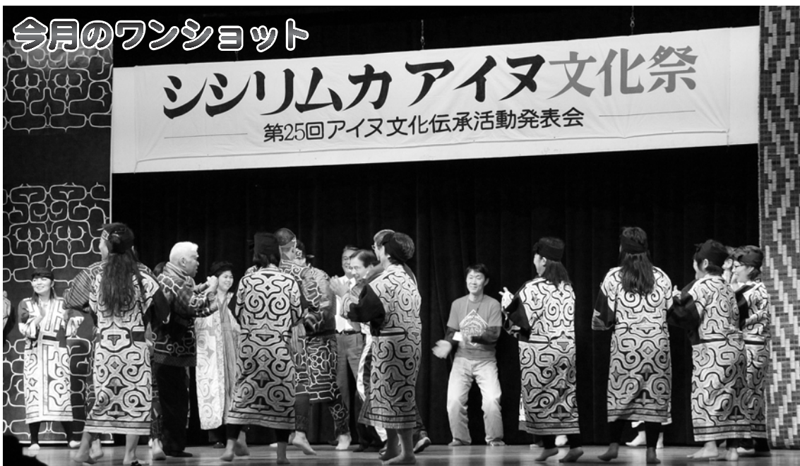
■シシリムカアイヌ文化祭 (2/16 中央公民館)