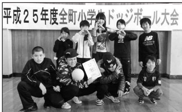
AK 69 チーム