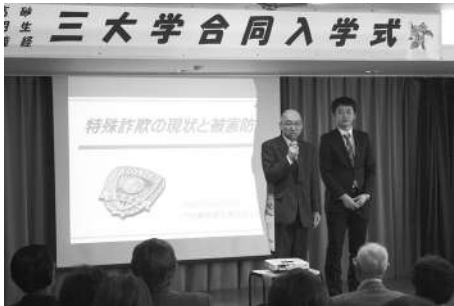
門別警察署署員による講話の様子

また、入学式終了後には、特殊詐欺などの被害が多発していることから、門別警察署生活安全課より「振り込め詐欺にあわないために」と題して講演があり、お金の請求の電話を受けた時に、恥ずかしいと思ってしまい、被害に合うケースが多いとのことで、家族に相談できなければ、ささいなことでも構わないので門別警察署に相談してくださいと話されました。