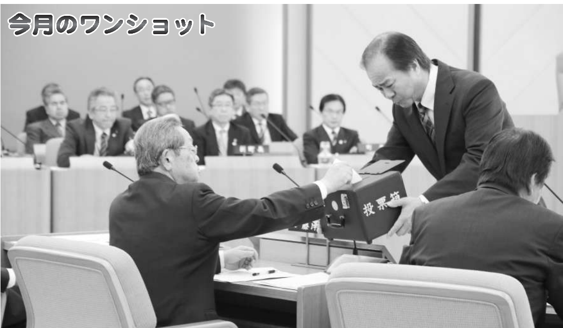
町議会臨時会 議長選挙投票風景 (5/8 役場議事堂)