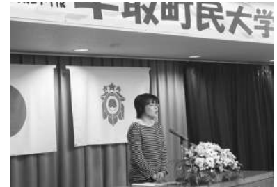
学生代表あいさつ