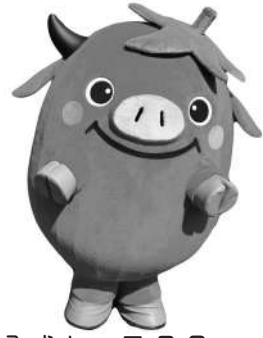
公式キャラクター「ビラッキー」