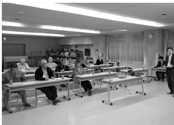
地域懇談会のようす（振内町民センター）

今後さらには、第6次総合計画に町民の皆さんの意見を反映させたいと考えています。総合計画の策定に関し、意見懇談会等開催の希望がありましたら、お問い合わせをお願いします。