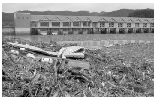
↑下流へ流木が流れるのを阻止した二風谷ダム