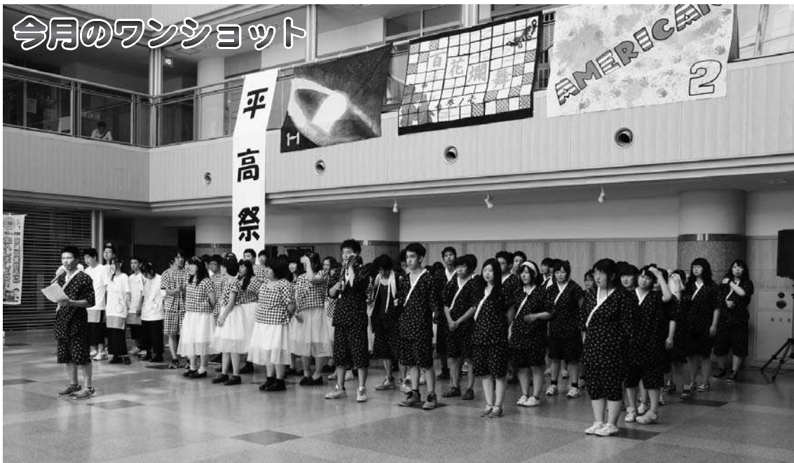
平取高校学校祭 クラスパフォーマンス (7/11 ふれあいセンターびらとり)