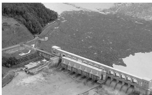
↑激しい出水で堆積した流木（平成 15 年）