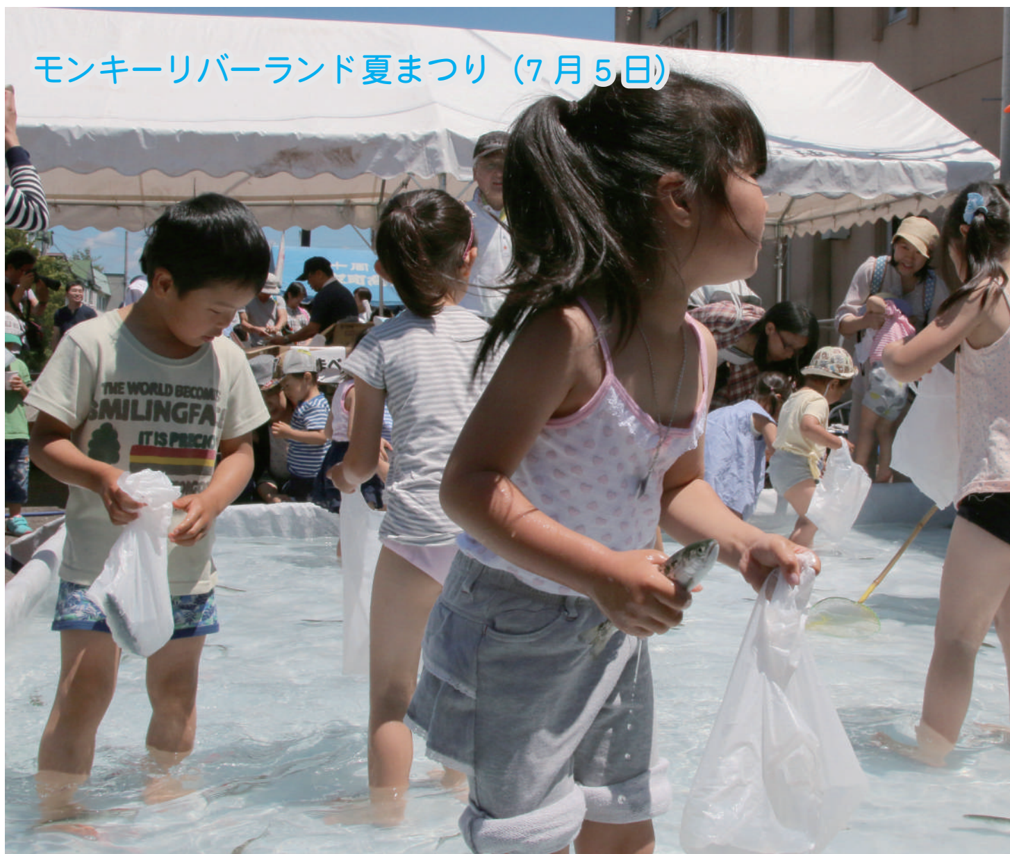
モンキーリバーランド夏まつり (7月5日)