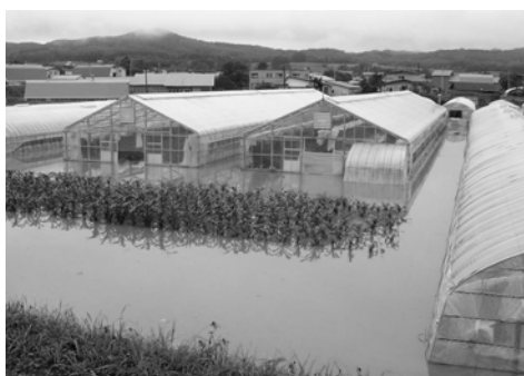
↑平成 18 年 前線降雨により野菜施設が浸水