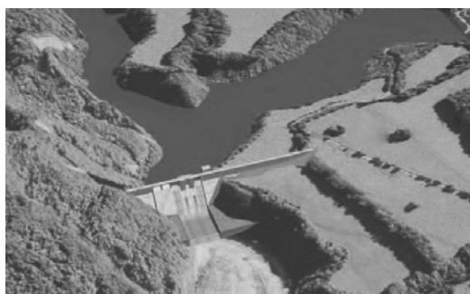
↑平取ダムの完成予想図

能を十分に発揮するには、両ダムの建設が必須なため、平取ダム建設促進協議会において国への要請を重ねてきた結果、平成25年度に着工となり、平成31年の完成に向けて着々と工事が進められています。