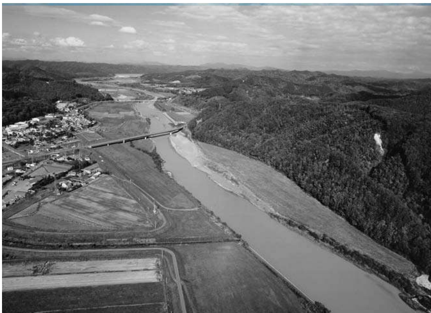
写真 沙流川の今日的な姿(平取町本町：南側から撮影)。かつては蛇行した流路の周辺に三日月湖と湿地帯が形成され、支流の多くは本流到達前に地中へと浸透していた

源流域の日勝峠付近に所在するスルク(エゾマツ)やフブ(トドマツ)の原生林は、昭和45(1970)年に「沙流川源流原始林」として国天然記念物に指定されています。