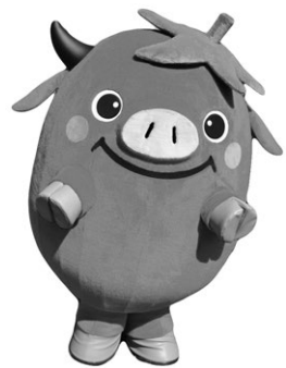
公式キャラクター 「ビラッキー」