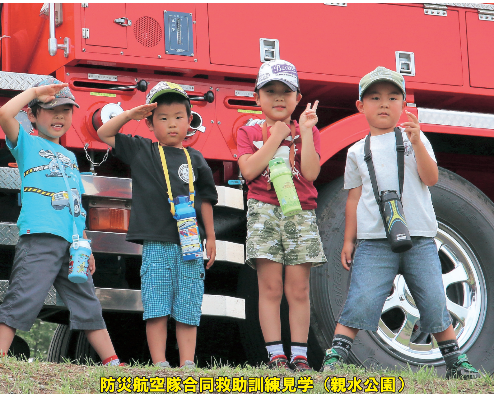
防災航空隊合同救助訓練見学（親水公園）