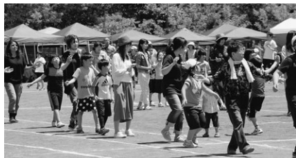
6/18 平取小：平取音頭&全校大玉おくり