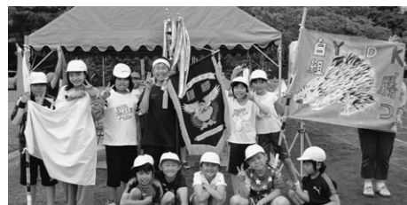
6/11 二風谷小：全校玉入れ&白組優勝