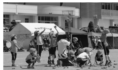
6/18 貫気別小：全校よさこい&全校玉入れ