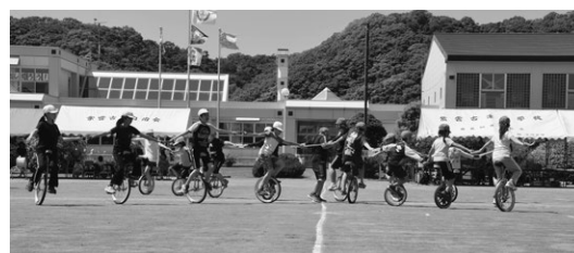
6/17 紫雲古津小：一輪車（アクアリウムパレード）