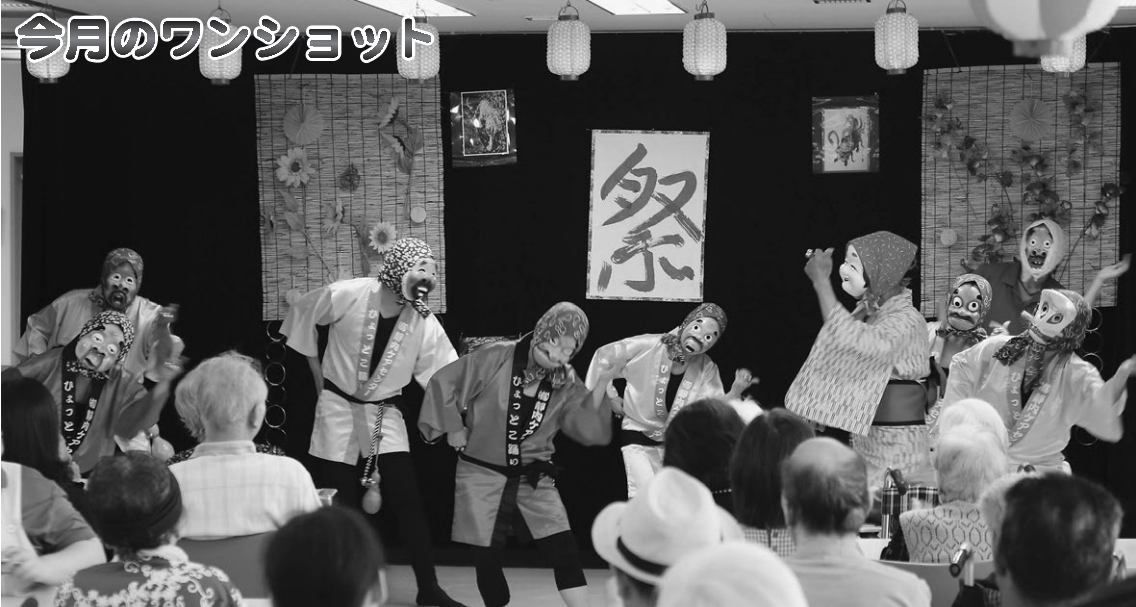
第27回かつら園祭り「ひょっこ踊り」(7/23)