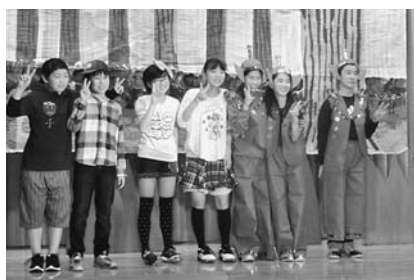
写真④ 6年劇 「宇宙人との約束」 7名の6年生 最高学年の力量発揮！