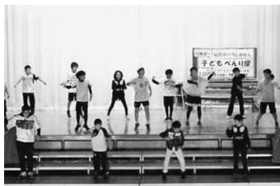
写真② 5・6年劇 「子ども便利屋さん」 14人が演じ踊り 本当に便利なものは？