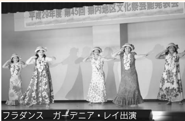
フラダンス ガーデニア・レイ出演