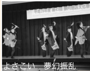
よきこい 夢幻振乱