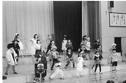
写真③ 1年遊戯・歌・器楽 「おどるポンゴコリン」 初めての学習発表会 緊張の中、演技に集中！