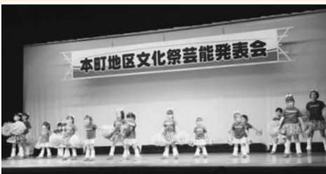
ダンス チア・エンジェルス出演