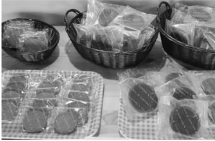
しばれいもっ粉の焼き菓子

上げたヘアゴムなどの商品や伝統工芸の素材を活かしたマスキングテープやタッセルなどの商品開発を行いました。