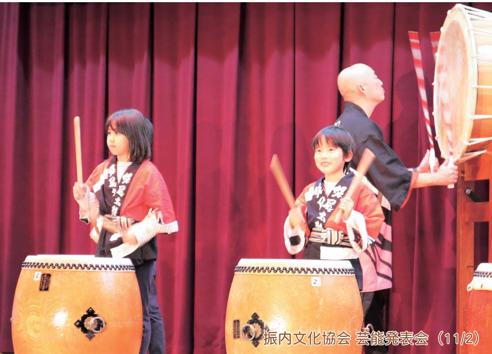
振内文化協会 芸能発表会 (11/2)