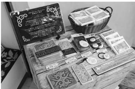
工芸品新商品の試験販売（東京）

農林畜産品・スイーツなど特産品開発としては、しばれ芋（ヘネイモ）を素材に用いた焼き菓子の開発に取り組んでいます。開発商品は、門別競馬場や札幌ドーム、サッポロファクトリー、東京代々木公園でのイベントや観光