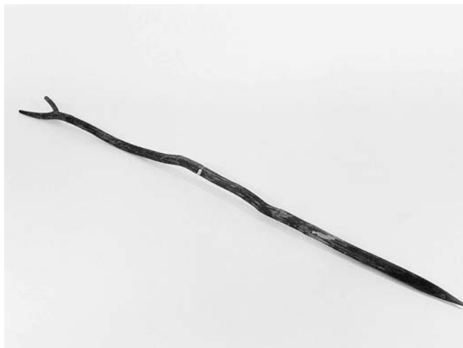
エキムネクワ (山杖)

年配の人が使う杖（つえ）のことをアイヌ語で、クワといいます。サビタの木で作られることが多く、美しいアイヌ模様を彫刻を施した作品を当館では展示しています。墓標のことも、クワといいます。これは死者がアイヌモシリ（人間の世界）から、シンリッモシリ（先祖の世界）に旅立つ時に暗い道を照らし出す松明（たいまつ）になるのだと考えられており、やはり杖のような存在だと言えます。