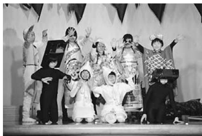
写真① 5・6年劇 「ゴミたちの環境サミット」 9人の心をあわせて 素晴らしい演技で！