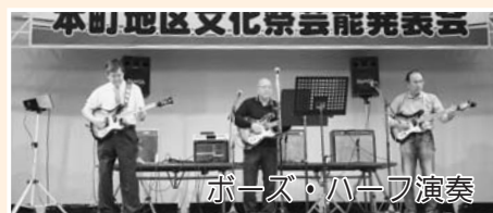
ポップス・ハープ演奏