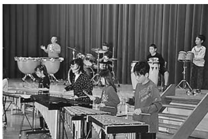
写真⑤ 全校器楽 「ロッキーのテーマ」 全校児童23人 各自の役割を果たし♪

■多くの方々の参観があり、地域としての学習発表会になっていました。保育所や老人会の参加の学校もありました。 ■奏でて、演じて、最高のステージの提供。今年度はダンスが多く、新しい風を吹き込んでいました。この成果を今後の生活に生かしていきましょう。