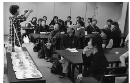
ツアーでのペンダント組立体験

どを取り入れたモニターツアーなどを行い、事業成果のとりまとめと譲渡を行っていく予定です。