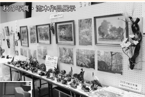
秋の写真・流木作品展示