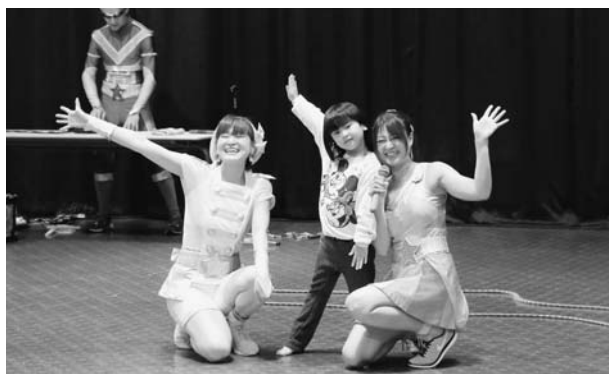
最後に一緒に決めポーズ！

ここ数年の演目は音楽とジャグリングが多かったですが、今回はいつもとは違うジャンルのものを提供することができ、園児の皆さんにとって楽しい1日になりました。