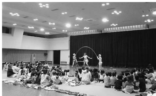
ダブルダッチの様子