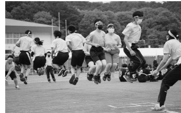
平取中学校 年間テーマ「極光」

5月31日(金)には平取中学校が、6月1日(土)には振内中学校が、体育大会を開催しました。平取中学校は今年度から平日開催となりましたが、昨年度同様たくさんの保護者の声援の下、生徒一人一人が取組の成果を発揮していました。振内中学校では、今年度から複式学級となり、教職員の人数が少ない中でしたが、地域の方々の応援と協力により、実りある大会となりました。