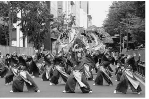
大通パレード会場 南コース