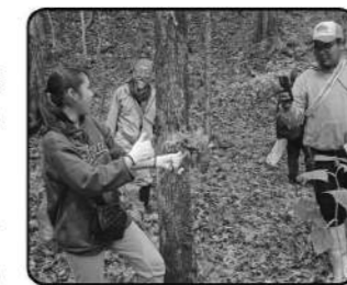
町主催イベント キナアカラ(山菜採り)