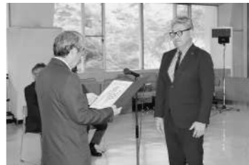
6月17日 当選証書付与

任期満了に伴う令和6年6月16日執行の平取町長選挙は、6月11日に告示され、現職の遠藤桂一氏（66歳）以外に立候補の届出がなく、無投票にて当選となりました。 6月17日(月)、当選証書付与式が行われ、互野選挙管理委員長から当選証書が手渡されました。 7月4日(木)、町議会臨時会において就任の宣誓、所信表明を行い、2期目の町政に向け、新たにスタートしました。