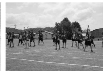
貫気別小学校 6月15日 「力を合わせ全力をつくせ!!」

1年生にとっては初めての運動会、ワクワクする反面練習が大変だったことでしょう。どの学校も、児童の集団としての力や、集中して取り組む力を養うなど、教育活動にとって大変意義のあるものとして力を入れています。一学期の最大行事である運動会で培った力が、今後の教育活動につながっていきます。