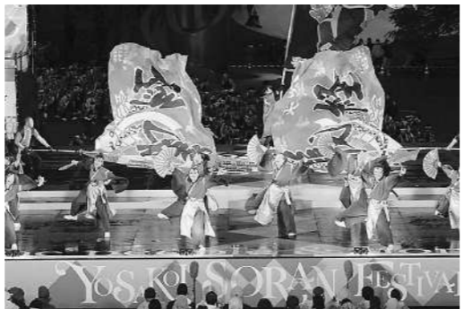
ファイナルステージ（大通公園西 8 丁目）

6 月 9 日(日)に行われたファイナルステージでは、感激と感謝の思いを込めて、笑顔あふれる元気いっぱい演舞を披露しました。