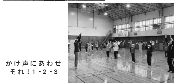
かけ声にあわせ それ!1・2・3