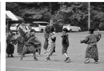
二風谷小学校 6月9日 今年アイヌ舞踊を披露!!