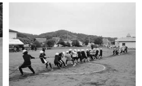
紫雲古津小学校 6月15日 「はばたけ 情熱の鳥 ～みんなが本気でもりあがれ～」