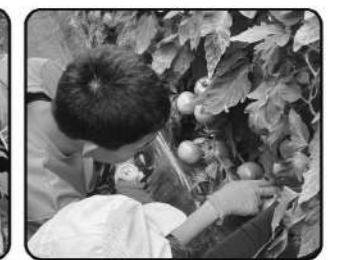
町内のトマト農家に 農業体験