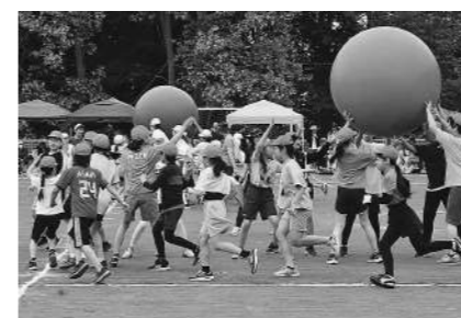
平取小学校 6月15日 「一致団結 ～力を合わせて全力で 勝利を目指せ!～」