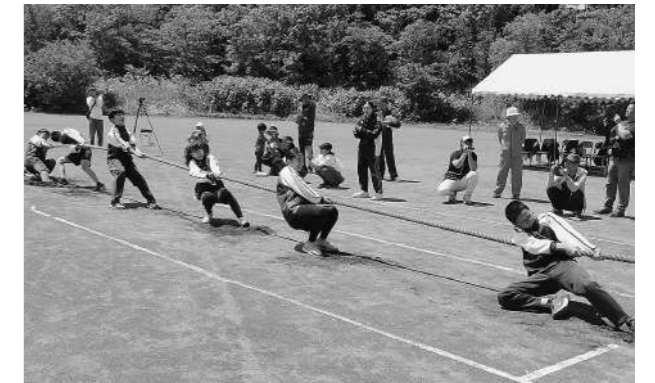
振内中学校 体育祭スローガン 「電光石火 OneHeart」