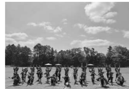
振内小学校 6月8日 「楽しく・協力あきらめないで いい運動会ヘレッツゴー!」