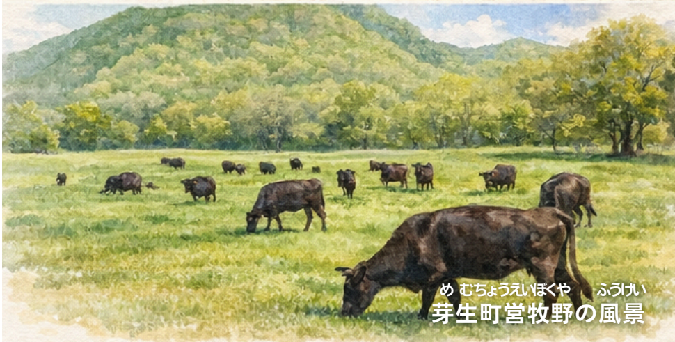
めむちょうえいほくや ふうかい 芽生町営牧野の風景