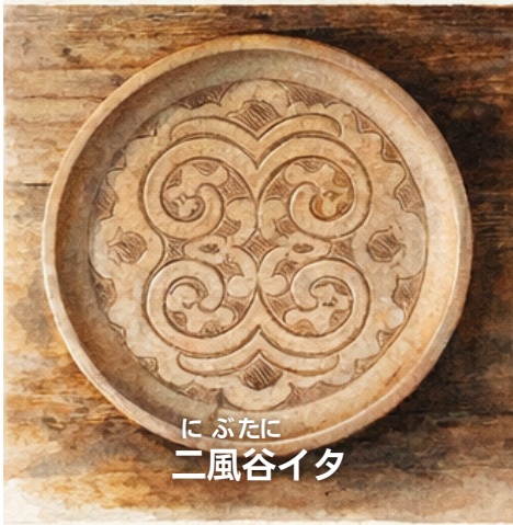
にぶたに 二風谷イタ