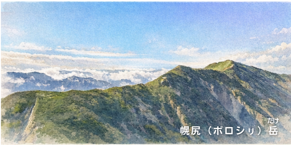
幌尻（ポロシリ） たけ 岳