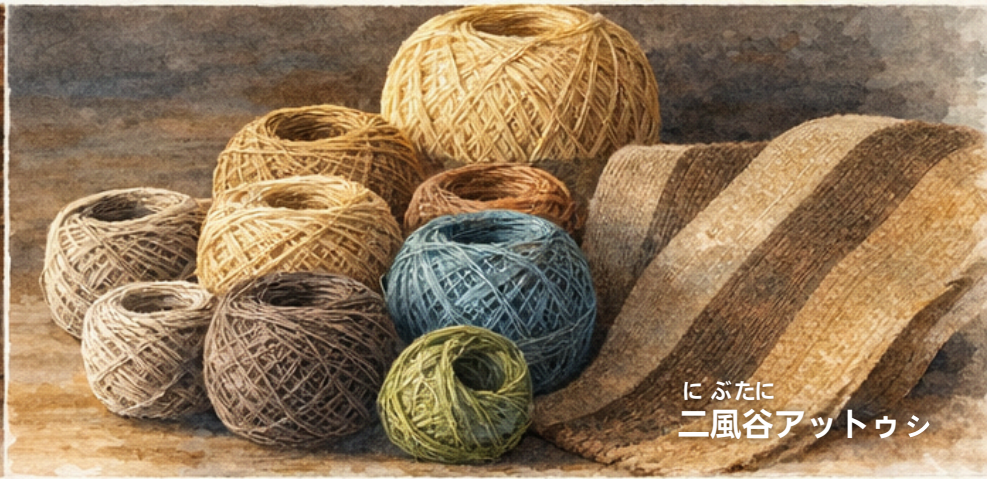
にぶたに 二風谷アットウシ